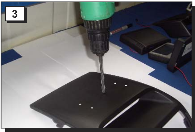
3 Ein 8mm Loch für die Kabeldurchführung bohren