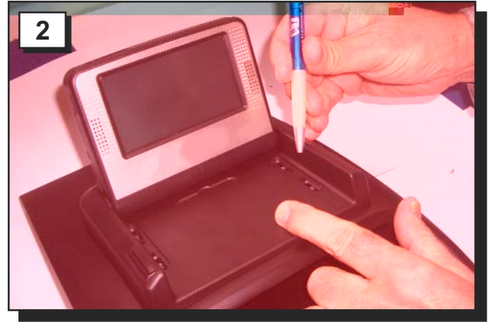
2 Befestigungen anzeichnen und 4x vorbohren