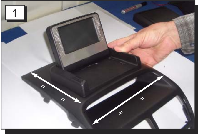
1 Gerät auf der Abdeckung oder dem Armaturenbrett ausrichten